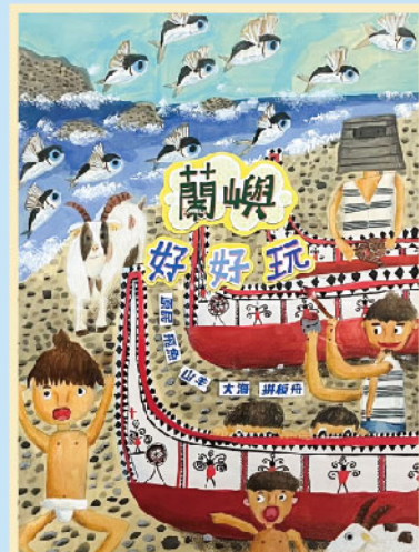
《蘭嶼好好玩》 402邱定城