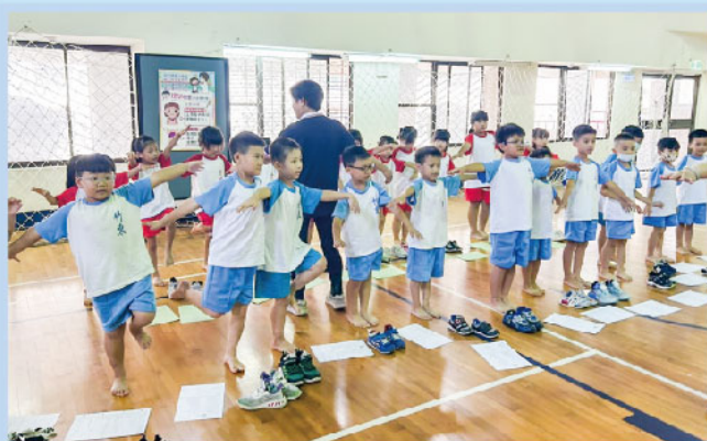
一、四年級健康檢查