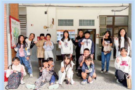
原住民語認證考試