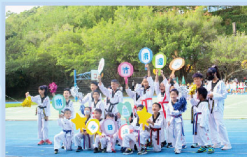
運動會跆拳道合照