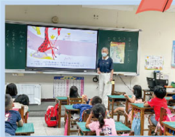
慈濟入班品德教育