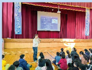
一氧化碳預防宣導