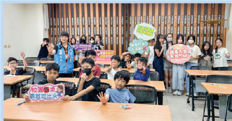
春暉認輔志工反毒入班宣導

最後，關於我的保養和維護方法：要給我健康的食物，比如適合我這種年齡吃的蔬菜、水果和一些肉類，還要讓我睡眠充足才能讓我有精神，更要帶我去公園運動。如果做了值得獎勵的事情，不要忘了準備一些玩具或是文具給我，以後說不定我會更努力表現。