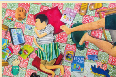
《當媽媽不在家》 402邱定城