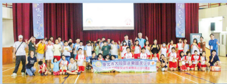
永樂國小到校參訪

現在，我明白了，幸福的味道，是一種踏實又安心的感覺。那晚飄出的香味，成了我心中永遠不會消失的溫暖，也會一直陪伴著我成長。