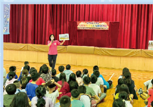
代間教育故事劇場體驗-小雅的噩夢